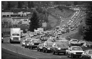
Seheindruck bei Nachtmyopie mit passenden Brillengläsern

Jackson, ebenfalls britischer Gelehrter, kam 1888 zu dem Ergebnis, dass es wohl an der weiter geöffneten Augenpupille liegen müsse und der damit verbundenen Wirkung der „sphärischen Aberration des Auges“: Je größer die Pupille, desto verwaschener wird das Bild, das ist auch vom Fotografieren bekannt: Je kleiner die Blendenöffnung, desto mehr Tiefenschärfe ist vorhanden! (und natürlich umgekehrt: Je größer die Blendenöffnung, desto verwaschener wird das Gesamtbild).